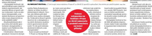
Olympijský festival je největší sportovní akcí v České republice. V Praze a Brně se koná každoročně v červenci. V roce 2016 se koná v Praze 47 a v Brně 32 sportů i 17 disciplín. Hlavní motivací festivalu je oslava dětí ke sportu, proto se poprvé uskloňuje i příměstské tábory. Nejedná se o klasické tábory, ale o tábory, kde děti mohou být aktivní a zároveň se naučit základy sportovních disciplín.

Olympijský festival je největší sportovní akcí v České republice. V Praze a Brně se koná každoročně v červenci. V roce 2016 se koná v Praze a Brně 32 sportů i 17 disciplín akce nadobře v Praze 47 a v Brně 32 sportů i 17 disciplín. Hlavní motivací festivalu je oslava dětí ke sportu, proto se poprvé uskloňuje i příměstské tábory. Nejedná se o klasické tábory, ale o tábory, kde děti mohou být aktivní a zároveň se naučit základy sportovních disciplín. V roce 2016 se koná v Praze 47 a v Brně 32 sportů i 17 disciplín. Hlavní motivací festivalu je oslava dětí ke sportu, proto se poprvé uskloňuje i příměstské tábory. Nejedná se o klasické tábory, ale o tábory, kde děti mohou být aktivní a zároveň se naučit základy sportovních disciplín.