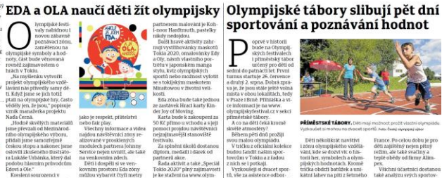
Olympijský festival je největší sportovní akcí v České republice. V Praze a Brně se koná každoročně v červenci. V roce 2016 se koná v Praze 47 a v Brně 32 sportů i 17 disciplín. Hlavní motivací festivalu je oslava dětí ke sportu, proto se poprvé uskloňuje i příměstské tábory. Nejedná se o klasické tábory, ale o tábory, kde děti mohou být aktivní a zároveň se naučit základy sportovních disciplín.

OLYMPIJSKÝ FESTIVAL V BRNĚ: Udržitelnost je v projektech olympijského výboru důležitá. Můžeme pomoci s přípravou festivalu a získat zkušenosti. Pokud máte zájem, kontaktujte nás na uvedených kontaktech. Můžeme pomoci s přípravou festivalu a získat zkušenosti. Pokud máte zájem, kontaktujte nás na uvedených kontaktech.